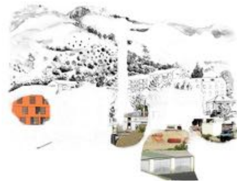
FIGURE 17 : Palinopsies . Série de photographies sur PVC, 60 x 50 cm, 2012.