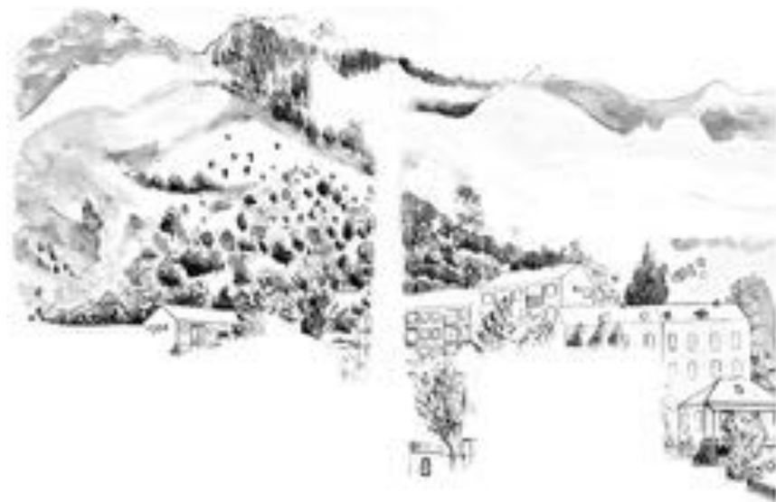
FIGURE 21 : Palinopsies . Série de photographies sur PVC, 60 x 50 cm, 2012.