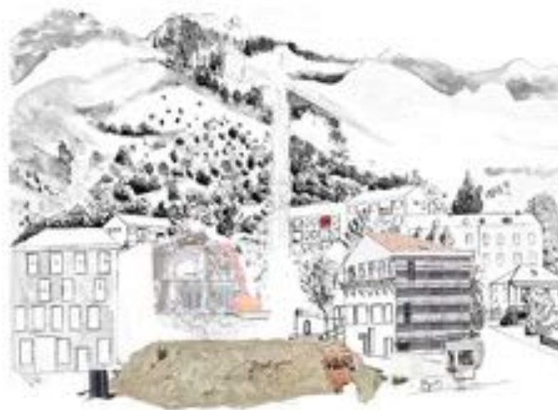
FIGURE 15 : Palinopsies . Série de photographies sur PVC, 60 x 50 cm, 2012.