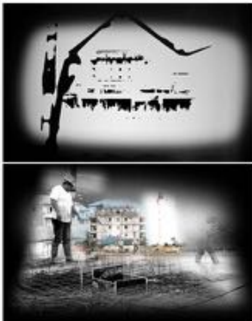
FIGURE 10 : Shifting Walls . Installation sonore vidéo & peinture sur mur, 290 x 170 cm, 10 minutes, 2017. Captures vidéographiques de l'installation.