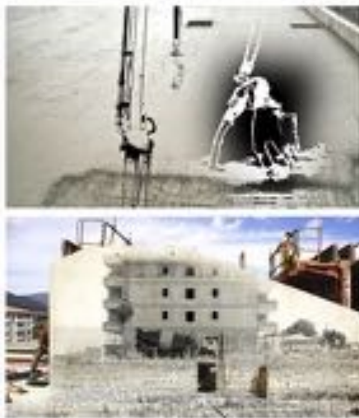
FIGURE 11 : Shifting walls - Immersion en chantiers . Captures vidéographiques de la vidéo monobande, 14 mn 20 et 4 mn 40, couleurs et n&b, stéréo, 2015.