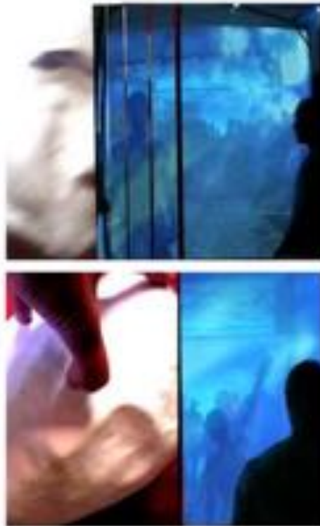
FIGURE 4 : Ultra-relativistic e-motion . Installation vidéochorégraphique pour 4 danseurs. 5 modules angulaires semi-transparentes. 9 vidéoprojecteurs et lecteurs DVD, une table de mixage en temps réel. Vidéogrammes extraits de la vidéo de présentation réalisée pendant la première par Harald Krytinar le 5 juillet 2005 à la Fondation Vasarely à Aix-en-Provence.