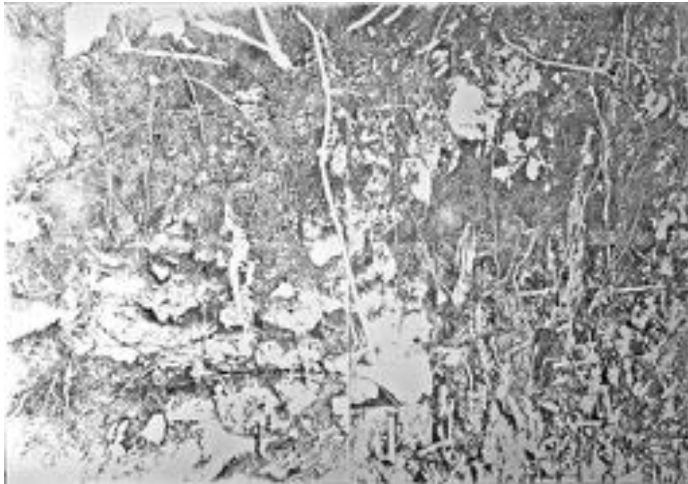
FIGURE 7 : “ Heady Roots ” - Polyptyque . Quatre dessins à l'encre de Chine et feutres noirs sur papier, 200 x 140 cm, 2016.

exactement comme l'écrit Deleuze : « une perception actuelle s'entoure d'une nébulosité d'images virtuelles qui se distribuent sur des circuits mouvants de plus en plus éloignés, de plus en plus larges, qui se font et se défont » (Deleuze et Parnet 1996, 180).