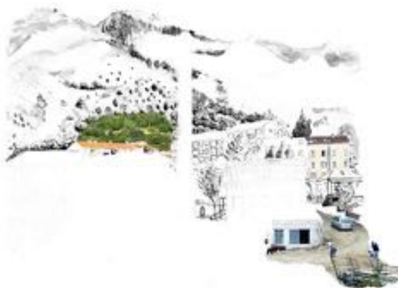
FIGURE 18 : Palinopsies . Série de photographies sur PVC, 60 x 50 cm, 2012.