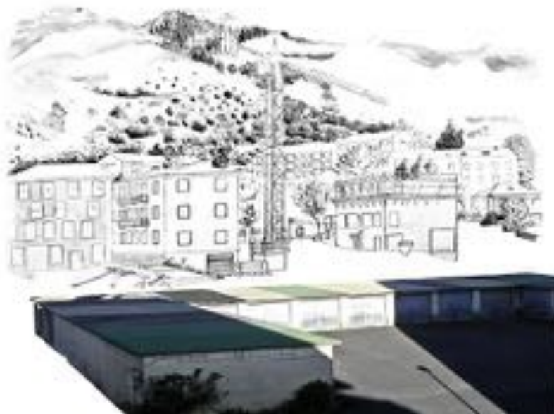
FIGURE 12 : Palinopsies . Série de photographies sur PVC, 60 x 50 cm, 2012.

des zones claires et colorées dans les lignes graphiques en noir et blanc qui s'estompent ou se renforcent au contact de ces restes d'espace. En présentant les mirages de reconstruction par la mémoire de diverses phases d'un chantier, plutôt que diverses phases de construction du lieu, il s'agit de donner à percevoir une stase, un entre-deux entre différentes temporalités. Il s'agit de mettre en œuvre une situation en équilibre, hétérotopique, celle d'un lieu en train de se construire au travers d'une multiplicité de lignes intensives simultanées afin d'ouvrir la perception à une écoute active, fluide, de mobiliser une attention stratigraphique.