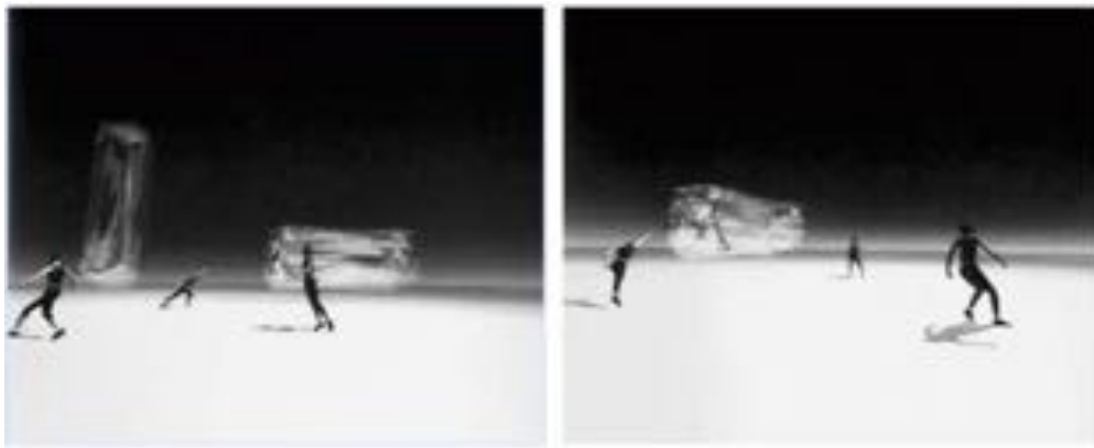
FIGURE 2 : N+N Corsino, Topologies de l'instant , 2002.

Le déroulement de la danse n'est plus alors paramétré par un agencement raisonnable de codes préétablis, mais par ce qui conduira le mouvement, dans une sorte de lâcher-prise, en des lieux inconnus. Si la danse transforme l'espace et si la caméra nous donne accès à des points de vue inédits dans les fictions chorégraphiques de Nicole et Norbert Corsino, les nouvelles technologies, et notamment le virtuel, expérimentent les capacités imprévues du corps afin de le solliciter davantage dans ses limites.