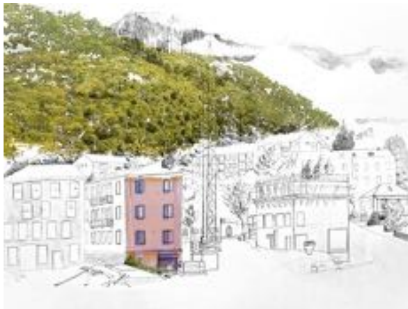
FIGURE 13 : Palinopsies . Série de photographies sur PVC, 60 x 50 cm, 2012.