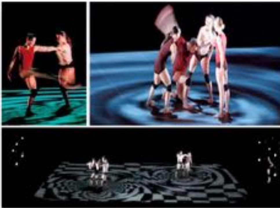
FIGURE 3 : Angelin Preljocaj et Hölger Förterer, Helikopter . Pièce pour 6 danseurs. Durée : 35 minutes. 2001.

où les danseurs apparaissent, dans un flux de lignes vidéo projetées au sol, comme des vecteurs d'intensité traversés par des milieux énergétiques. Ils concrétisent les propos de José Gil qui définit la chorégraphie comme champ de forces : « dramaturgie de forces, de tensions, de brisures, de lenteurs, de vitesses, d'accroissements et de modulations d'intensités, de déploiements, de chocs et de conjonctures d'espaces ». Ce champ de force est visible au sol dans Helikopter , où des lignes géométriques dérivent au contact des danseurs en courbures, figures du rapport à l'autre selon Levinas et établit un dialogue entre le corps des danseurs et leurs images.