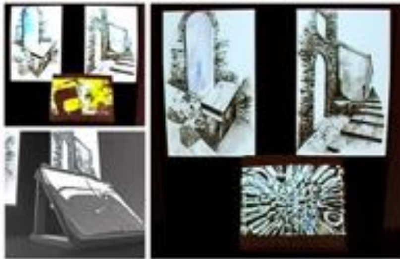
FIGURE 8 : Lignes d'erre I . Installation sonore, vidéographique et dessinée. Technique mixte : un livre de plâtre et d'argile de 47 x 55 cm sur pupitre en bois, deux lavis de 80 x 60 cm et vidéo-projections, 9mn15, 2011. Vue d'exposition à la galerie du centre Culturel Una Volta à Bastia en 2011.

Comme l'explique Gilles Deleuze, le nomade n'est pas forcément, de façon paradoxale, quelqu'un qui bouge car il existe des voyages sur place, des voyages en intensité (Deleuze 1973, 168-69). D'ailleurs, historiquement, les nomades ne sont pas ceux qui bougent comme les migrants, mais au contraire ce sont ceux qui ne se déplacent pas, et qui se mettent à nomadiser pour rester à la même place, en échappant aux codes.