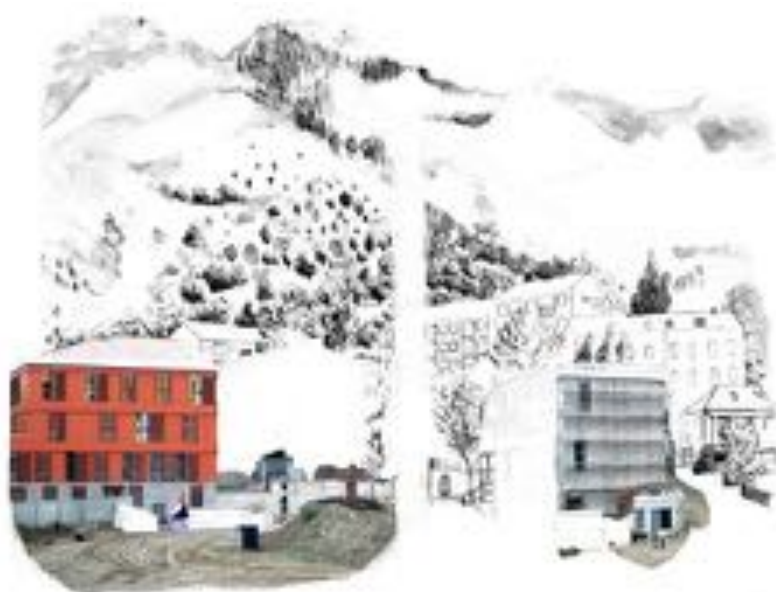
FIGURE 16 : Palinopsies . Série de photographies sur PVC, 60 x 50 cm, 2012.