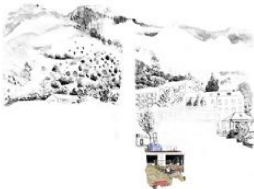
FIGURE 20 : Palinopsies . Série de photographies sur PVC, 60 x 50 cm, 2012.