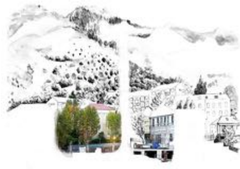
FIGURE 19 : Palinopsies . Série de photographies sur PVC, 60 x 50 cm, 2012.