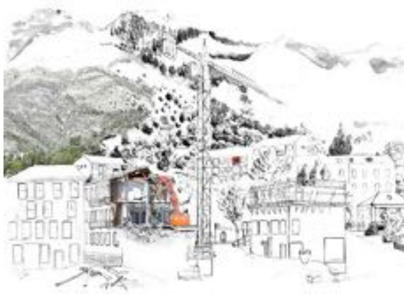
FIGURE 14 : Palinopsies . Série de photographies sur PVC, 60 x 50 cm, 2012.