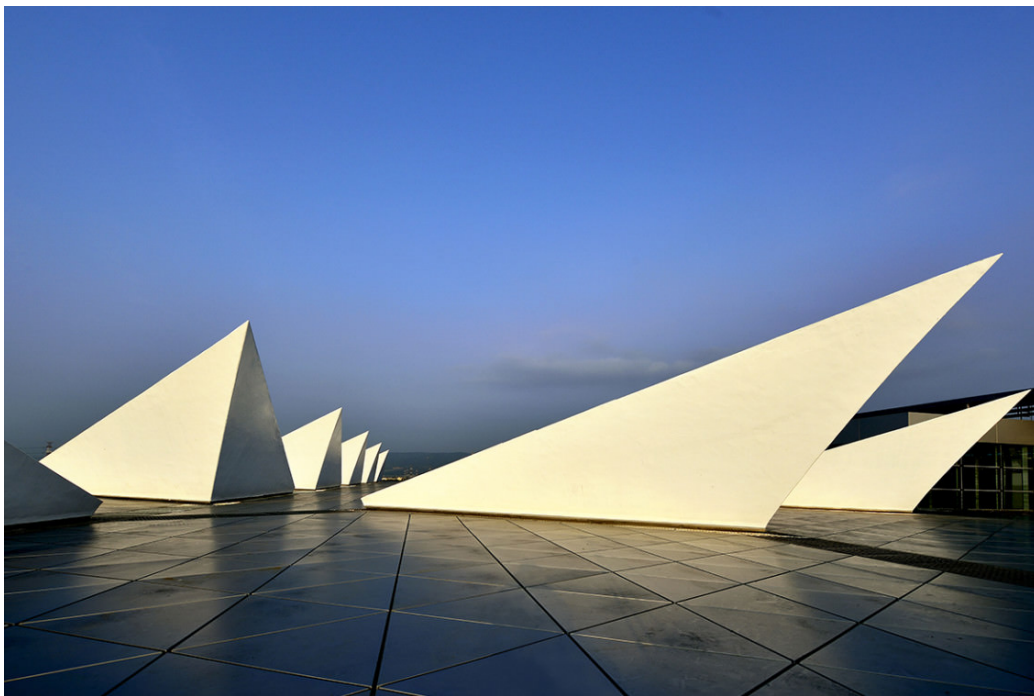
FIGURE 1 – Crédit photo : Kris Yao