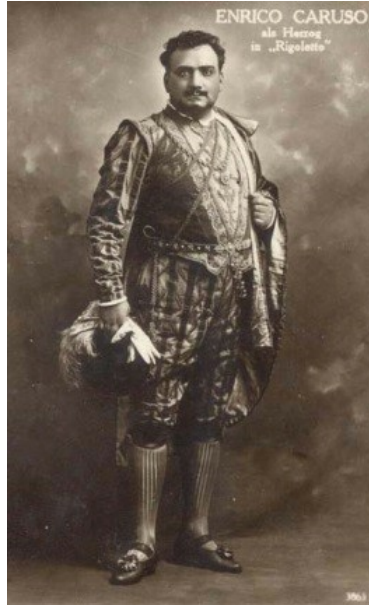
Illustration 6 : Caruso en Herzog ( Rigoletto )