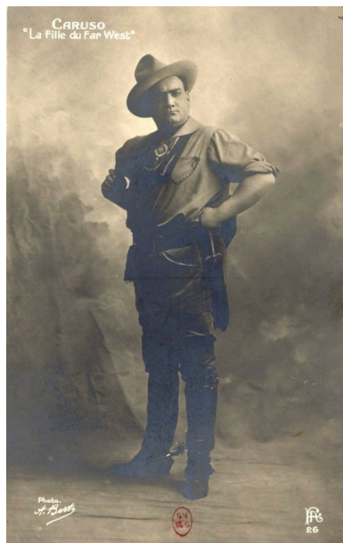
Illustration 7 : Caruso en Dick Johnson ( La Fille du Far-West )