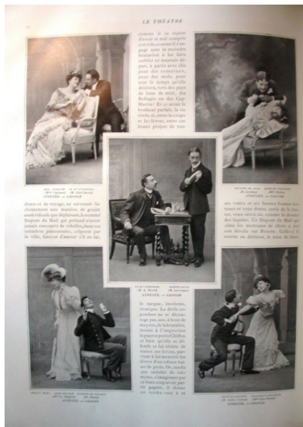
Illustration 3A : Paul Nadar. Clichés tirés de la revue Le Théâtre , n°143, novembre 1904, p. 11

chant son partenaire ; ou encore une scène de flirt appuyé au milieu d'une église (?) mais sur une chaise de salon.