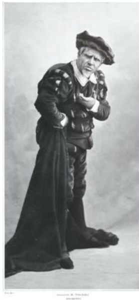
Illustration 5 : Titta Ruffo en Rigoletto ( Le Théâtre , n°324, juin 1912, 12).