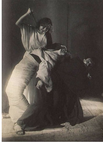
Illustration 10 : L'Assassinat. Cliché de couverture d'E. Lotar (Artaud 1931)