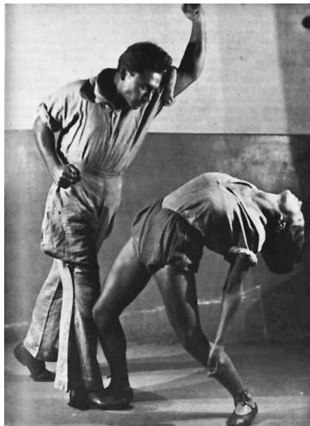
Illustration 11 : Pose de biomécanique — Le coup de poignard