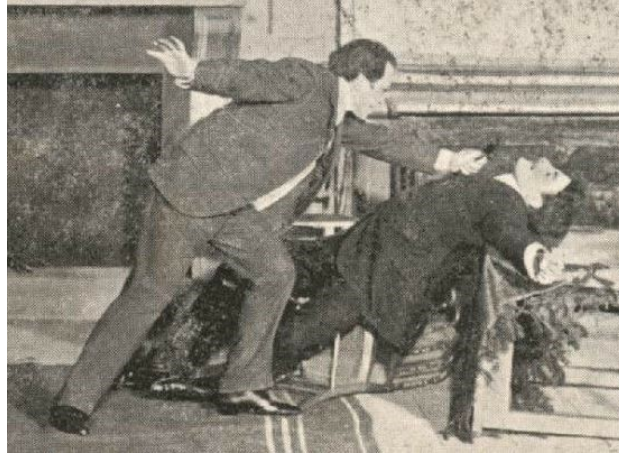
Illustration 12 : Roule-ta-bosse , Théâtre de l'Ambigu, 1906, 5e tableau : « Souviens-toi de mon père ! » ; détail inversé d'une carte postale de la collection du Photo-programme.