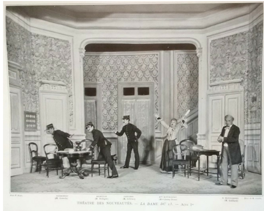
Illustration 8 : La Dame du 23 .

Ailleurs, ce sont les poses outrées, les équilibres instables, qui, au-delà du grotesque du référent, semblent jaillis d'un autre monde, comme annonçant déjà certaines tentatives surréalistes (illustrations 8 et 9).