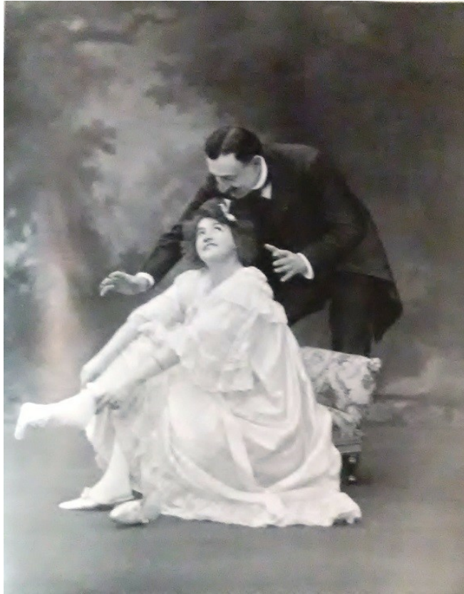
Illustration 3B : Paul Nadar. Cliché tiré de la revue Le Théâtre , n°143, novembre 1904, p.12.