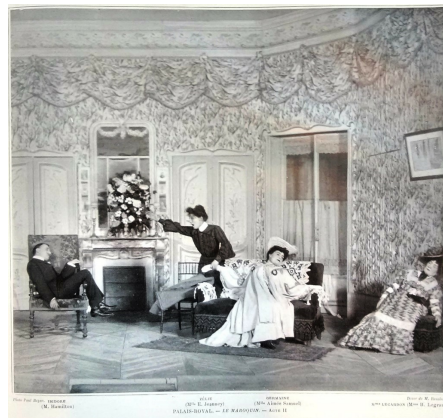
Illustration 9 : Le Marouquin . Cliché Paul Boyer, tiré de la revue Le Théâtre , novembre 1904, 17.