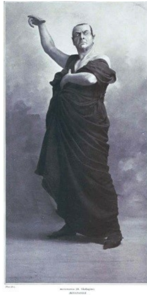
Illustration 4 : Chaliapine en Mefistofele ( Le Théâtre , n°324, juin 1912, 14).