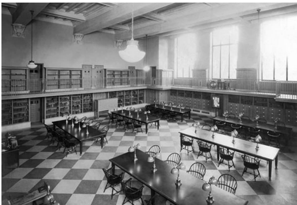
FIGURE 2 – Figure 2 : Salle de musique de la Free Library de Philadelphie vers 1927 2