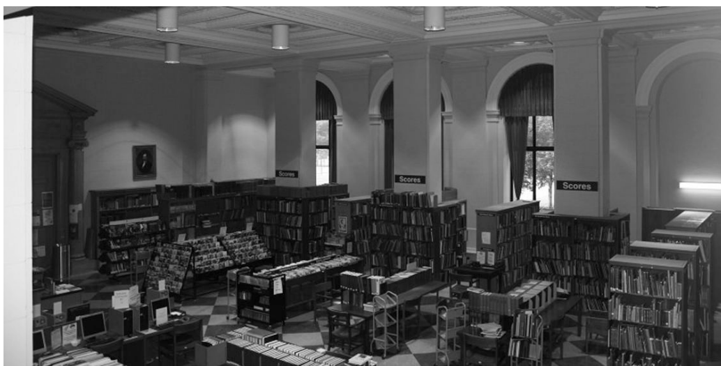
FIGURE 1 – Figure 1 : Salle de musique de l'actuelle Free Library de Philadelphie

Jetons un coup d'oeil à la Free Library de Philadelphie telle qu'elle est aujourd'hui :