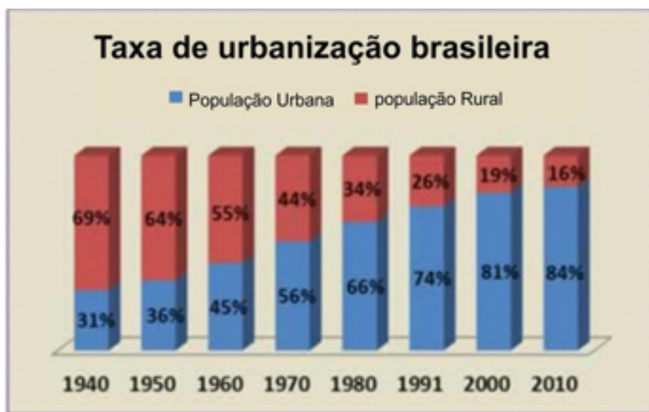
Figura 1: Aumento da urbanização por décadas.

Esse sistema de classes nascido em áreas rurais sobreviveu nas cidades, uma vez que a urbanização e a industrialização no Brasil foram tardias. De acordo com a Figura 1, pode-se afirmar que a população urbana superou, de forma significativa, a população rural apenas nos anos 1980. Outra questão importante : o processo, complexo e não linear, de urbanização e industrialização do Brasil foi resultado, antes de tudo, do investimento de proprietários rurais, de comerciantes exportadores e importadores, de banqueiros brasileiros e do Estado, particularmente a partir dos anos 1930 e durante os anos 1950 a 1980. Evidentemente, a industrialização mais recente foi feita com os investimentos dos conglomerados financeiros internacionais que influenciaram na economia brasileira a partir de 1956, com o governo de Juscelino Kubitschek (1956-1961), assim como durante os governos militares (1964-1985).