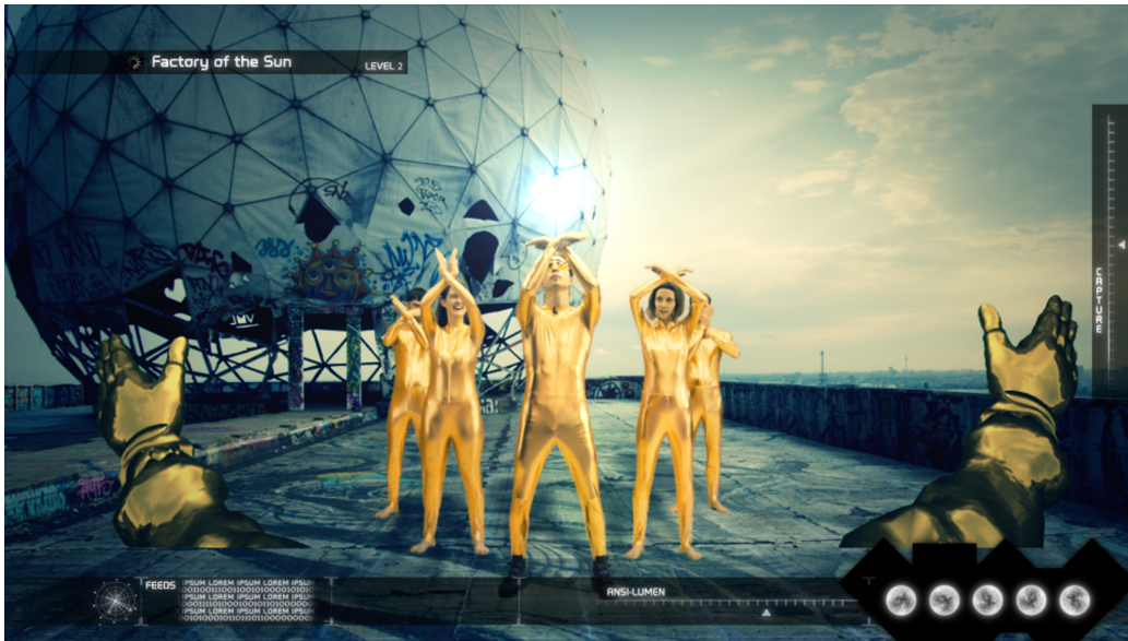
FIGURE 1 – Factory of the Sun , 2015. Single channel high definition video, environment, luminescent LE grid, beach chairs 23 minutes

accélérée par la Deutsche Bank, dans cette fiction dystopique, Yulia incarne une reconfiguration du cyborg, être hybride techno-humain. À l'ère de l'hypercirculation des images et des données, l'artiste détourne le motif de la lumière pour explorer les possibilités de résistance collective face à un monde de plus en plus virtuel où l'omniprésence de la surveillance a été banalisée et est ainsi devenue encore plus dangereuse. Les quelques mots prononcés par Yulia, « J'encode un jeu qui s'appelle Factory of the Sun . Mais vous ne pourrez pas jouer à ce jeu. C'est lui qui se jouera de vous » (Archey 2016, 195), confirme l'aspect fictionnel de l'action qui se déroule et le rôle joué par le personnage. Alors que se succèdent les images d'une danse collective, d'un rassemblement de protestataires diffusées à la télévision, d'une simulation de jeu vidéo de tir, la créatrice vidéoludique émerge comme le symbole de la contestation contre les formes de dominations sociales, politiques, économiques et militaires et les mécanismes de pouvoir aboutissant au contrôle du quotidien.